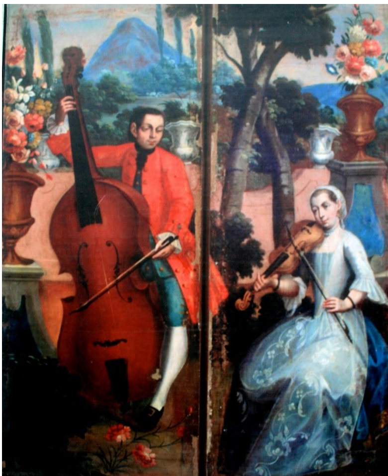
Fig. 3: Biombo anónimo del siglo XVIII. Concierto en la Alameda de México, detalle de tañedores de violón y violín, Museo Franz Mayer.

Los finos muebles originales fueron desapareciendo y se sustituyeron al gusto de las nuevas modas más prácticas y modernas. Papeles, archivos y libros fueron subastados, robados y hasta quemados.