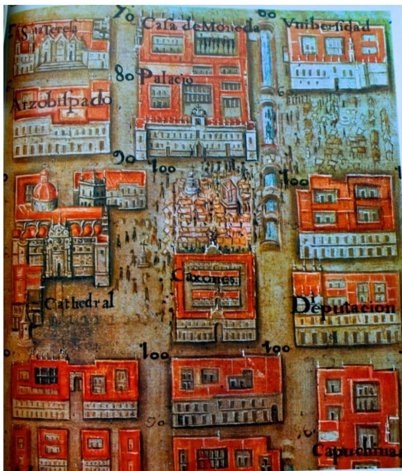
Fig. 5: Plano de la Ciudad de Pedro Arrieta (1737).

El conde don Miguel, como violinista diestro, tocaría algunas partes lucidas con la orquesta y otros miembros o amigos de la casa. Discípulos del maestro de música o algún hábil criado, se agregarían a estas tertulias musicales. Frecuentemente se invitaba a profesionales de ciertos instrumentos, cantantes de renombre, bailarines o a diletantes aventajados para eventos específicos a los que el mismo virrey y el maestro de capilla de catedral, don Ignacio Jerusalén como violinista, asistían. También era invitado don Miguel a convites en el palacio real como el de la noche del 6 de enero de 1758, donde se sirvió un amplio refresco , con la asistencia de muchas señoras de distinción .