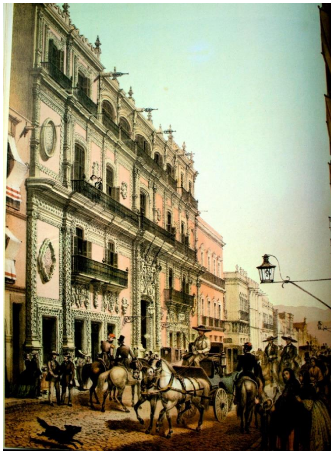
Fig. 6: Casa de los marqueses de Jaral de Berrio a principios del siglo XIX.

realejo de continuos, y dirigidos muy posiblemente desde el violín solista, por el maestro de la casa.