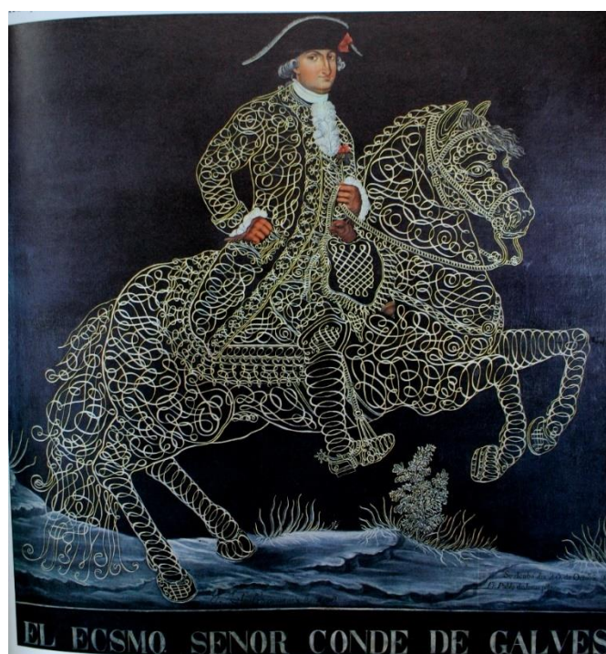
Fig. 7: Retrato del Virrey de Galves, de fray Pablo de Jesús (1796), Museo de Historia del Castillo de Chapultepec.

Un estudio de las nóminas de pagos de servidumbre de la casa, revelará más puntualmente la constitución básica de la plantilla de músicos, rara vez más de 3 o 4, a los que se podían agregar para algún evento especial, músicos de la capilla musical catedralicia y otros recién llegados a la corte. Cantantes, actores y bailarines provenientes del Teatro del Coliseo, también actuaban en representaciones y conciertos, en la privacidad de los salones de esta hermosa casona.