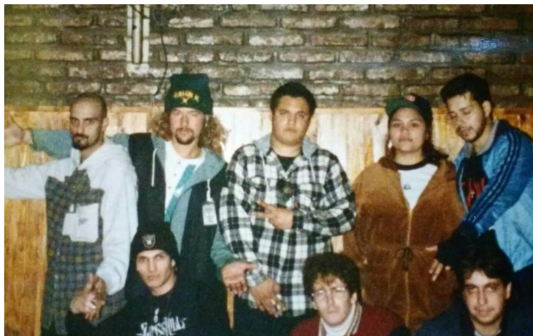
Fig. 4: Breakers vieja escuela en Villa Madero, La Matanza, zona oeste.

de 1990), DJ Bart (en la década de 1990 organizador de las fiestas de Tatin 12 y Dj de 9 mm ). Esta primera experiencia dio origen a varios raperos (y Djs también) que fueron fundamentales en la movida del género en la década siguiente.