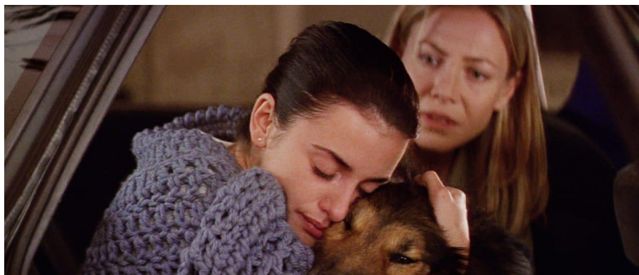
Fig. 3: La emisión sonora empática: el último reencuentro de Rosa con su perro.

fragilidad de los personajes, uniendo sus propias historias impactantes. El desahogo del sentimiento nostálgico de Rosa se interpone entre su realidad dolorosa y la infancia durante su último reencuentro con su perro y padre amnésico que no la reconoce.