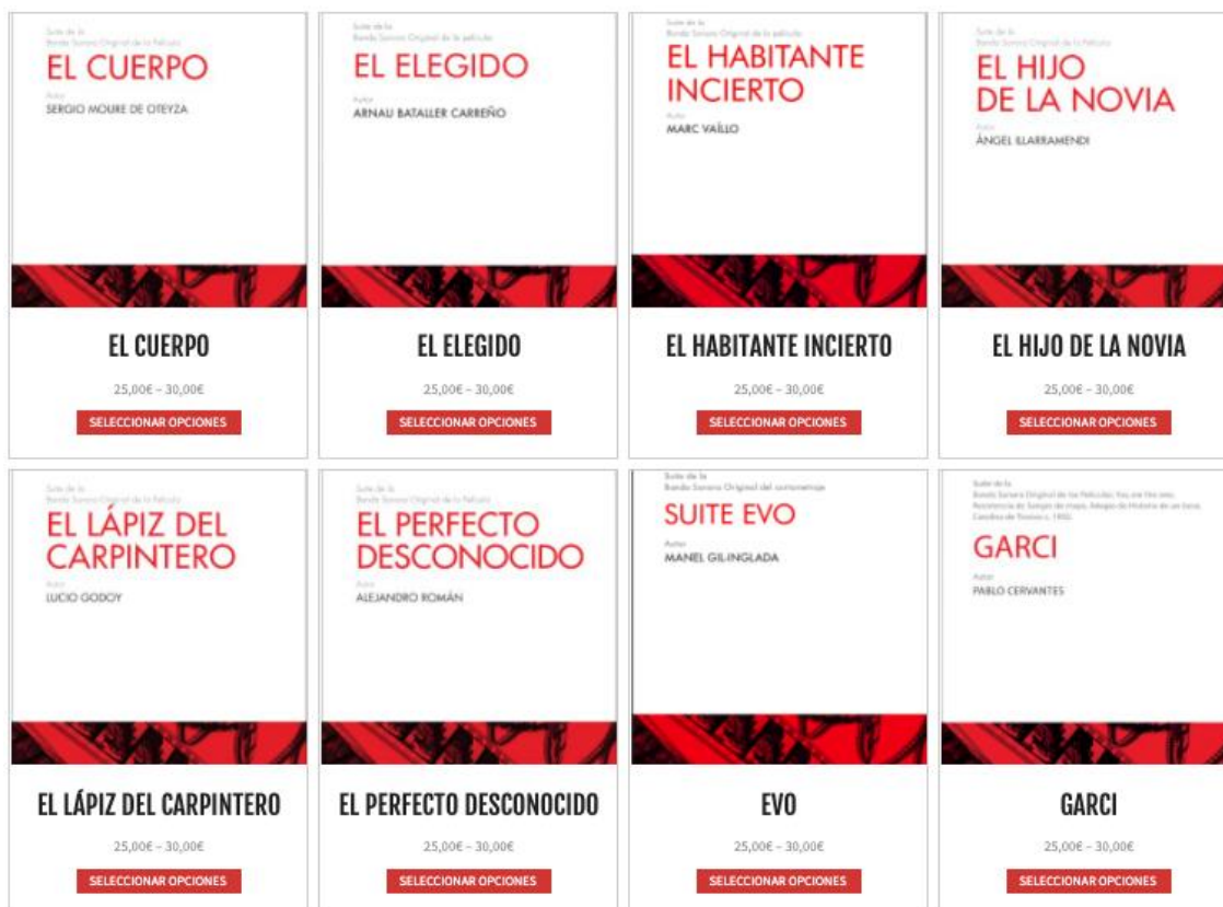
Fig. 4: Parte del Catálogo de suites de Musimagen, según se expone en su página web

El material se alquila a precio marcado por el mercado con el fin de respetar la labor de las editoriales; no obstante, dado que el principal objetivo de esta iniciativa es difundir la música de cine en el repertorio de las grandes orquestas, en Musimagen estudian la cesión sin coste en determinados casos. Los beneficios procedentes del alquiler se destinan a la realización de nuevas partituras.