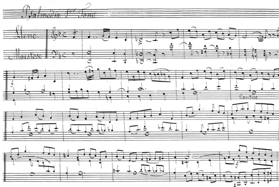
Fig. 11: Salmodia Choralis , 1r Tono, de Magí Pontí (colección particular).