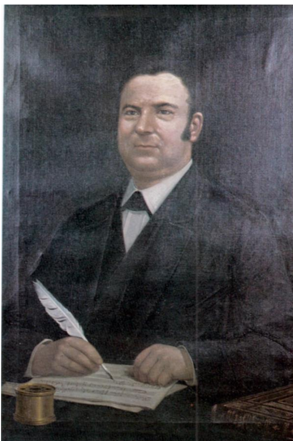
Fig. 9: Retrato de Magí Pontí, en la Galeria de Manresans Il·lustrats , obra de Francisco Morell. (La partitura se refiere a su Salmodià ).

En el 25 aniversario de su muerte, en la Casa de la Misericordia, de Lleida, se estrenó una Misa de Lorenzo Perosi, cantada por gran número de profesores, que en su mayor parte habían sido sus alumnos 44 .