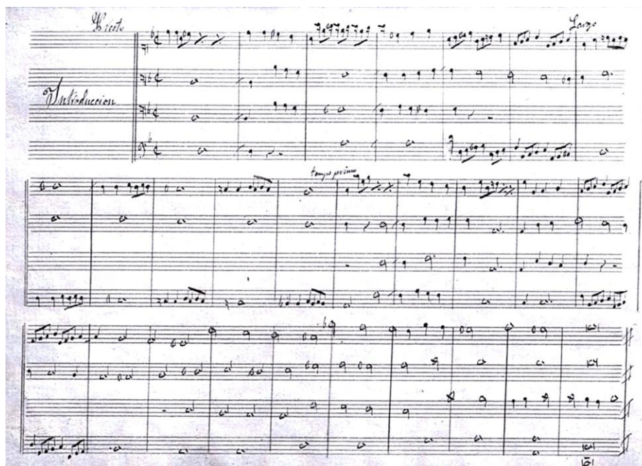
Fig. 4: Fragmento de la Fuga que realizó para la oposición (1833) (E-LEc: Ms 002).

En efecto, la ejecución del maestro en el órgano, su prodigioso mecanismo rayaban en lo inverosímil: abusaba, es cierto, de las combinaciones ternarias en una mano, contrastando con las binarias en la otra, pero en el uso de los registros, en los efectos que de su combinación sacaba, en la vis inagotable de su improvisación, por desgracia demasiado fácil, no ha habido maestro en estos últimos tiempos que le haya igualado, dada la influencia deletérea que en los maestros de capilla y, principalmente, en los organistas produjeron las obras del llamado cisne de Pésaro, que, en realidad de verdad, debió llamarse sirena y no cisne (Arteaga, 1886, p. 551).