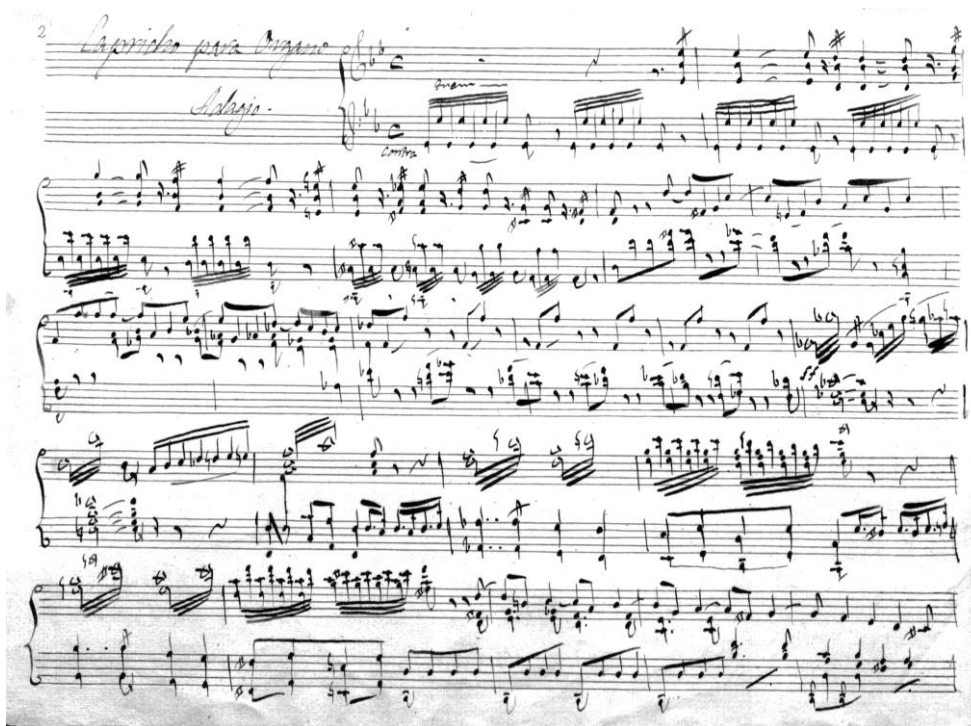
Fig. 2: Capricho para órgano , de Magí Pontí (E-LEc: Ms. 025).

[...] que en dos años tendrá colocada toda la armazón de Caja, esculturas y demás carpintería a punto de colocar los secretos, registros, teclados, y flauta, todo según arte. El se proveerá de buenos materiales: metal, estaño, hierros, cuero... excepto la madera que se la proporcionará el Cabildo [...].