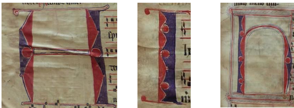
Fig. 2: Letras capitales del Antifonario de Barbastro (E-BAR s.s.). (Elaboración propia).