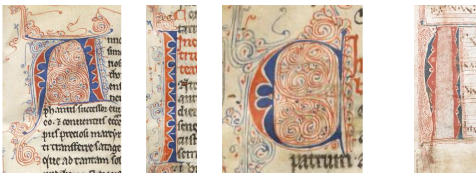
Escorial E-E T.I.12

La letra capital distintiva de E-E T.I.12 presenta un cuerpo relleno adornado con una decoración basada en zigzag, complementada con pequeñas borlas o perlas y alternando los colores rojo y azul. Además, cuando la inicial lo amerita, se utiliza decoración de filigrana en su interior en tinta roja o azul. Se han identificado varias similitudes decorativas, siendo una de las conexiones más destacadas la concordancia con el fragmento de Sigüenza (E-SIG frag. 14) 2 y el antifonario de Barbastro (E-BAR s.s.) 3 , figuras 2 y 3 respectivamente.