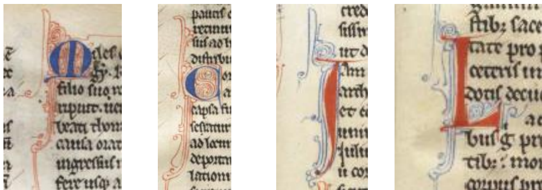
Fig. 3: Letras secundarias de E-E T.I.12 (Elaboración propia).

Las iniciales secundarias de E-E T.I.12 se caracterizan por tener una letra sencilla cuyo cuerpo está completamente relleno de tinta azul o roja, lo que constituye un rasgo característico de los manuscritos que datan de finales del siglo XIII y principios del XIV. Además, alrededor de la letra, se aprecian adornos de filigrana en tinta roja o azul, que son similares a los empleados en esa época (ver figura 3).