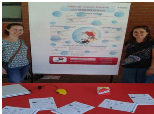
Imágenes 5 y 6: Exposición de proyectos en las Jornadas de Julio de AKOE Escola de Mestres.

Como conclusión final, se pueda afirmar que la metodología de proyectos de educación literaria es una forma de planificación eficaz que responde a los objetivos y a las necesidades que la sociedad actual demanda a la enseñanza literaria. Y que constituye, también, en el ámbito universitario un instrumento válido para la observación y la investigación por parte del profesorado ya que permiten crear nuevos escenarios, dispositivos y prácticas en el aula para entrelazar saberes, integrar conocimientos, desarrollar competencias básicas y específicas y conseguir aprendizaje pertinentes (Morin, 1999), con la intención de contribuir a la innovación didáctica desde la práctica docente, la investigación y la reflexión posterior.