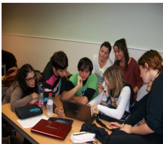
Imagen 1: Diseñando la presentación del taller de creatividad en la página web. (Trabajo conjunto de los estudiantes de Magisterio y del CFGS de Informática).