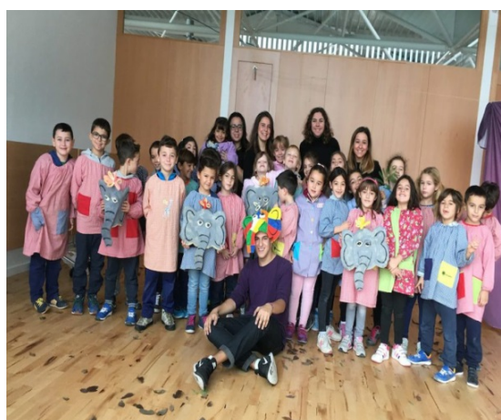
Imagen 2: Realización del taller de una aula de educación primaria.