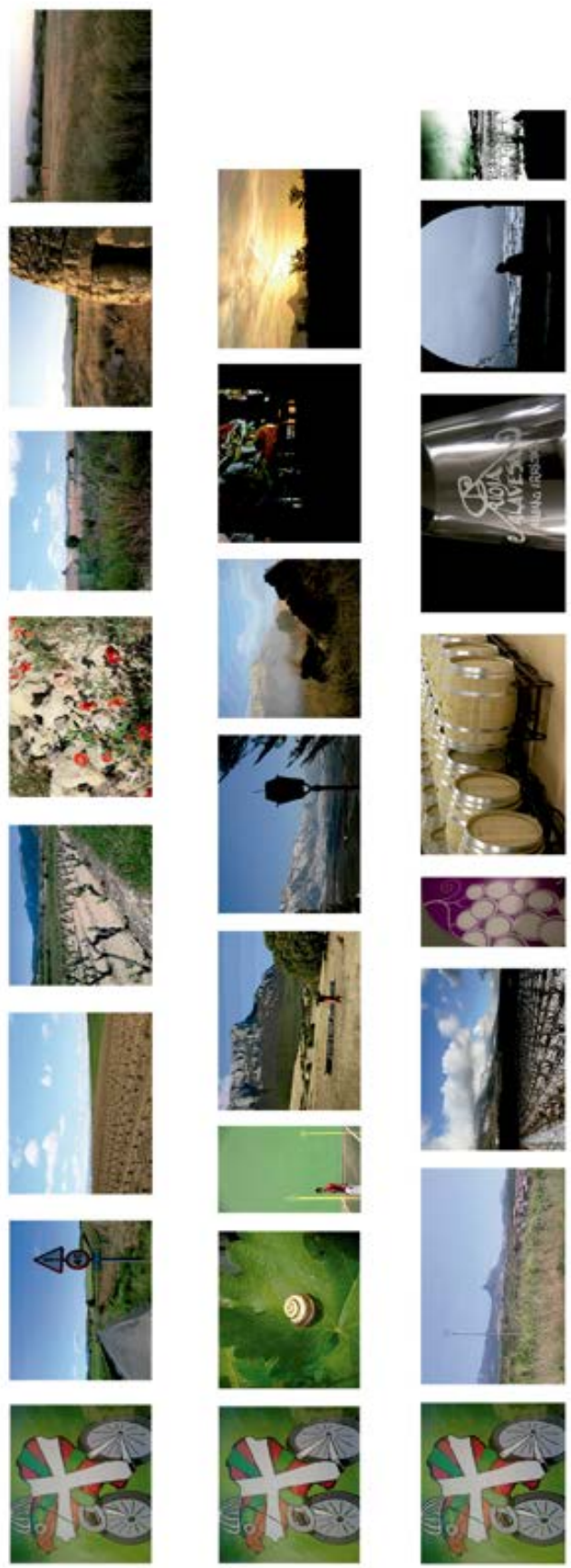
Figura 2. Foto-Diálogos como reflejo del Paisaje. Esther, Carlos y Kris.