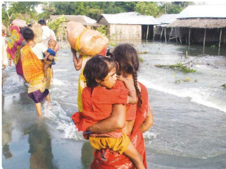
Imagen 1. Imagen del Monzón que se recoge en el libro de sexto de Educación Primaria de Ciencias Sociales (Editorial Santillana). Fuente: Grence y Gregori (2015).