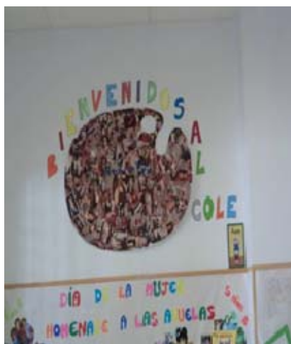
Imagen 12: Cartel bienvenida CEIP Félix Revello de Toro

El último centro que tuvimos la oportunidad de visitar fue el CEIP “Revello de Toro”, una institución de enseñanza bilingüe con una interesante metodología de trabajo por proyectos en Educación Infantil.