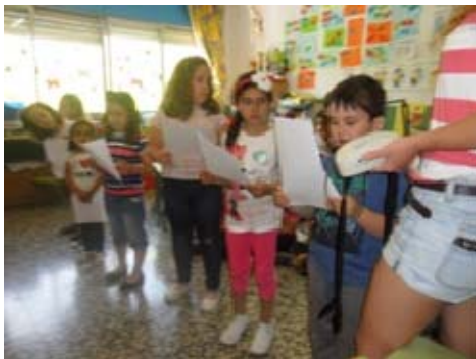
Imagen 7: Lectura biografía Miró

Una de las actividades que, sin duda, se presentaban más atrayentes para nuestro alumnado era la programación de una serie de visitas a diferentes Centros de Educación Infantil de Málaga que destacaban, fundamentalmente, por la puesta en práctica de Proyectos Educativos Innovadores. El primero de ellos fue el CEIP “Virgen de Belén”, el cual se encontraba en ese momento desarrollando un Proyecto de Trabajo sobre el pintor Miró con los niños y niñas de 5 años. Para nuestra sorpresa, fueron ellos mismos quienes nos dieron la bienvenida, leyeron la biografía de Miró y nos enseñaron algunas de las actividades realizadas en el aula.