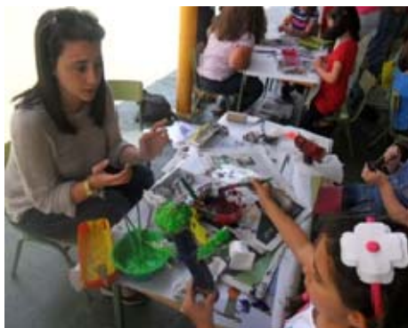
Imagen 9: Taller de esculturas

El siguiente centro visitado fue el CEIP “Nuestra Señora de Gracia”, un colegio premiado por el MEC en el área de Atención Compensatoria que se caracteriza por contar con una comunidad educativa organizada mediante asambleas, una