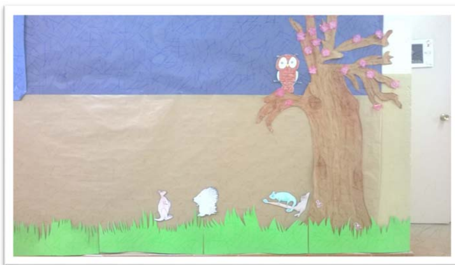
Ilustración 1: Avances en el diseño del rincón sobre El Bosque de la Economía.

ilustraciones y materiales audiovisuales, la lectura de los cuentos en el aula se ha desarrollado adjudicando a los niños el papel de ilustradores y diseñadores. Así los alumnos de infantil y primaria se han visto así mismo envueltos en una importante tarea de elaboración de ilustraciones, marionetas de dedo, figuras de goma eva,...hasta permitir la creación del rincón de El Bosque de la Economía (como se observa en la Ilustración 1, correspondiente al CEIP Campo Charro de Salamanca) o la realización en algunos centros de concursos de dibujo sobre El Bosque de la Economía.