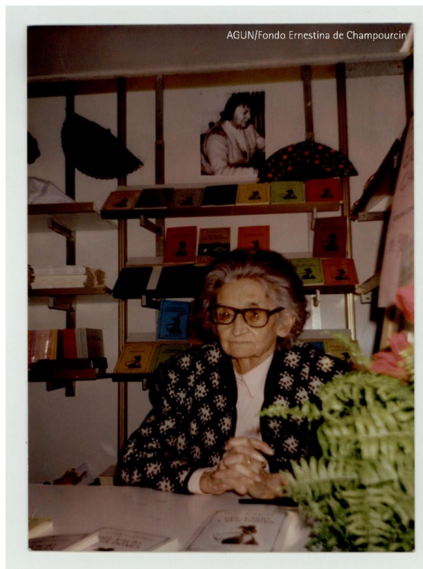
Ilustración 3 Ernestina de Champourcin en un stand de la Feria del Libro con una fotografía a su espalda de la poeta Gloria Fuertes

Ernestina de Champourcin falleció en Madrid el 27 de marzo de 1999 a la edad de 93 años. Su obra se ha ido descubriendo y revalorizando poco a poco. Ejemplo de ello son las publicaciones, tesis doctorales, documentales, exposiciones, congresos y premios con el nombre de la poeta vitoriana.