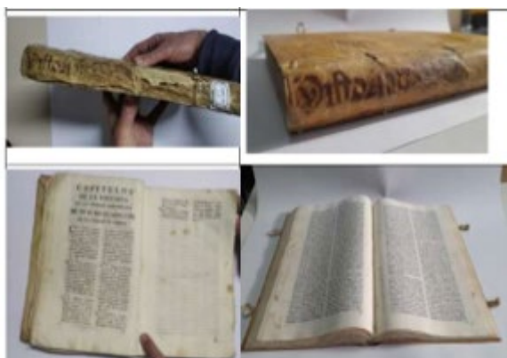
Ejemplo de libro antiguo

Se comenzó entonces, de forma puntual, la adquisición de cajas de conservación según la medida exacta de los libros, así como a contactar con empresas de restauración. De esta forma confirmamos que el proceso de acidez no es reversible y que la mayor parte de los libros que la sufren en esta biblioteca están destinados a desaparecer porque no se podía hacer una desacidificación masiva. Es decir, comenzamos a plantearnos, por una parte, la importancia de conservar el contenido científico a través de la digitalización de más de 3.000 libros con papel ácido, y por otra, a ver la necesidad de digitalizar y, posteriormente a restaurar otras obras por su valor como objetos patrimoniales.