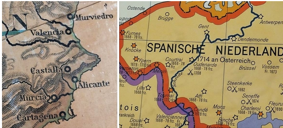
Figuras 2 y 3.

Mapa mural del S.XIX y mapa mural de la década de 1960, donde se muestran los distintos elementos de composición.