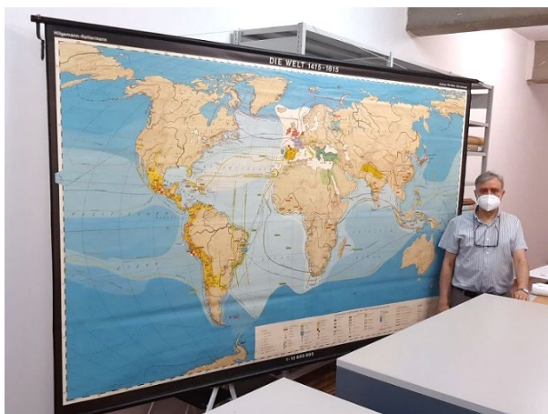
Figura 1. Mapa mural extendido

El formato. Son mapas de gran tamaño, con hasta varios metros de lado, editados en varias hojas, que se entelaban para montarlos y a los que se añadían listones en su parte superior e inferior para poder fijarlos en las paredes y colgar o descolgar a conveniencia. En cuanto a su impresión, fueron usados los distintos sistemas que aparecieron durante estos años: de la litografía al offset o incluso a materiales plásticos.