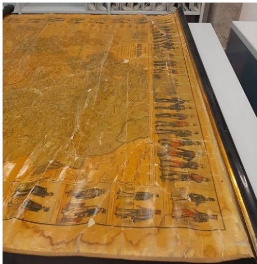
Mapa mural del S.XIX con distintos desperfectos

Un tercer grupo es el de aquellos mapas que presentan un deterioro más importante, que están siendo restaurados directamente por el personal de restauración del Servicio de Bibliotecas.