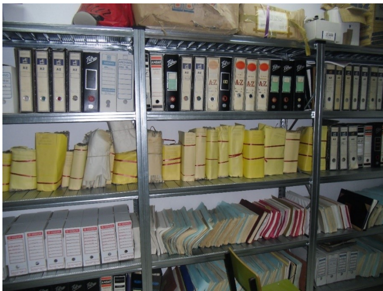
Imagen 3 Documentos en el almacén del edificio E´lhuyar

En la evaluación de los fondos documentales de la Escuela de Minas de Almadén, realizada por el Archivo Universitario en el año 2009, se constató que la documentación se encontraba distribuida en diversas dependencias de la Escuela situadas en los edificios E´lhuyar y Storr y que su volumen ocupaba unos 70 metros lineales aproximadamente.