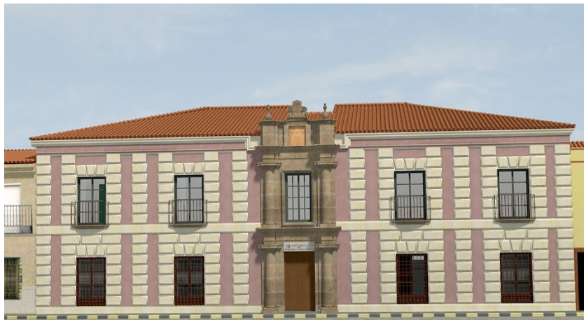
Imagen 1 Recreación de la Casa Academia de Minas de Almadén http://eimia.uclm.es/academia/

Tras este breve recorrido por la historia de la Academia de Minas de Almadén, se debe destacar el legado cultural y simbólico que ha dejado en la zona. En primer lugar en el patrimonio artístico e histórico de Almadén, con las obras dieciochescas que integraban el complejo académico cuya principal característica es el eje de simetría y elementos decorativos de estilo neoclásico como las cadenas rústicas, las pilastras y el frontón, que pueden apreciarse de una manera más nítida en la fachada principal.