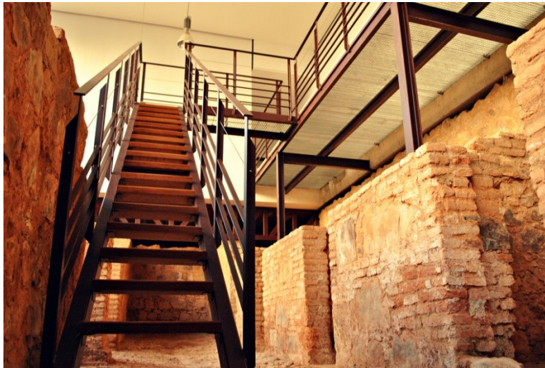
Imagen 2 Real Cárcel de Forzados http://eimia.uclm.es/

En aras de conservar y recuperar el patrimonio documental histórico de Almadén se crea, en el año 2004, el Archivo Histórico de Minas de Almadén, en el cual se conserva toda la documentación referente a las minas, que se encontraba antes en el archivo de la sociedad Minas de Almadén y Arrayanes, S.A. Los documentos más antiguos que conservan datan de mediados del siglo XVII, puesto que los anteriores están recogidos en la sección Fondos Contemporáneos-Minas de Almadén del Archivo Histórico Nacional 5 .