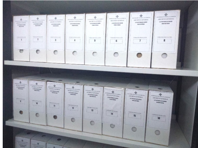
Imagen 6 Instalación de los fondos documentales