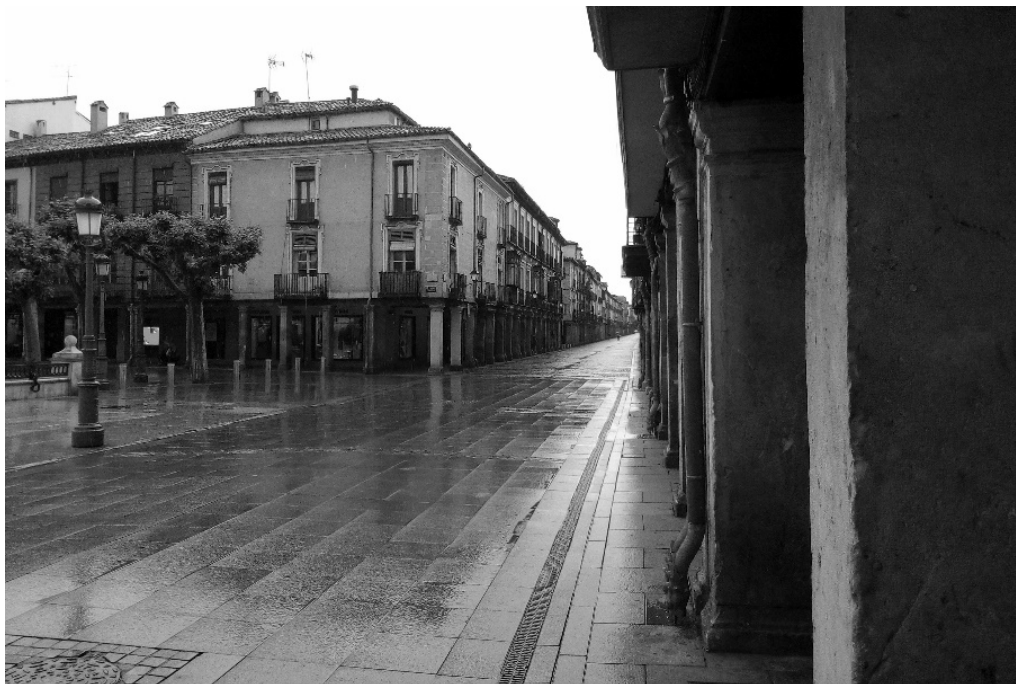
Imagen 2 Alcalá Fase 0