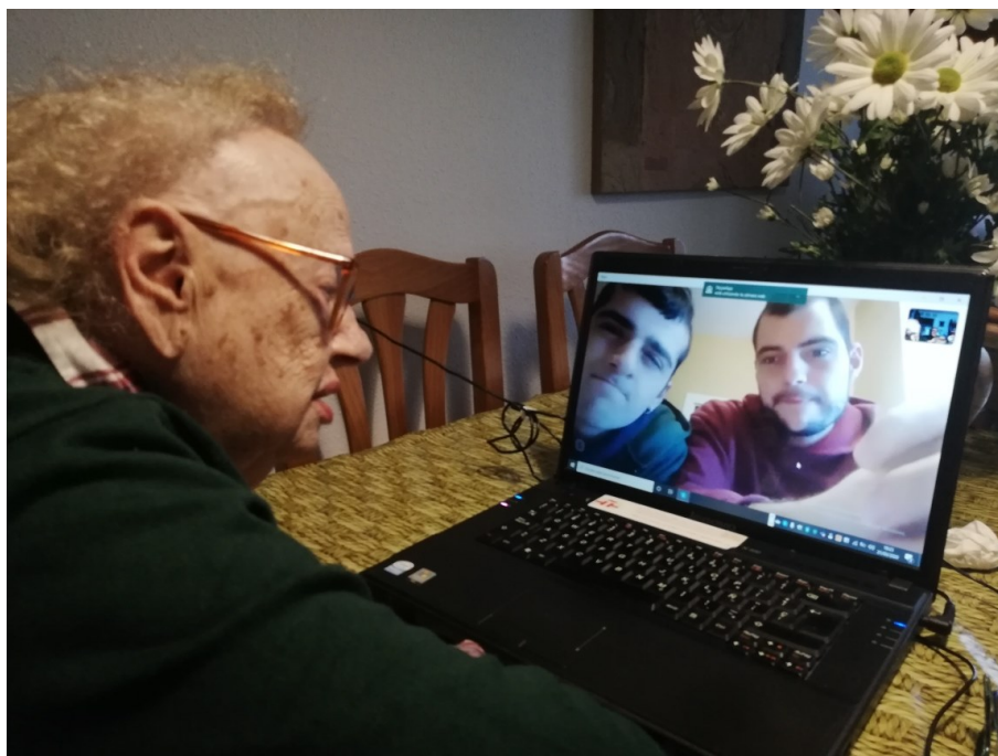
Imagen 3 La abuela hace una videoconferencia