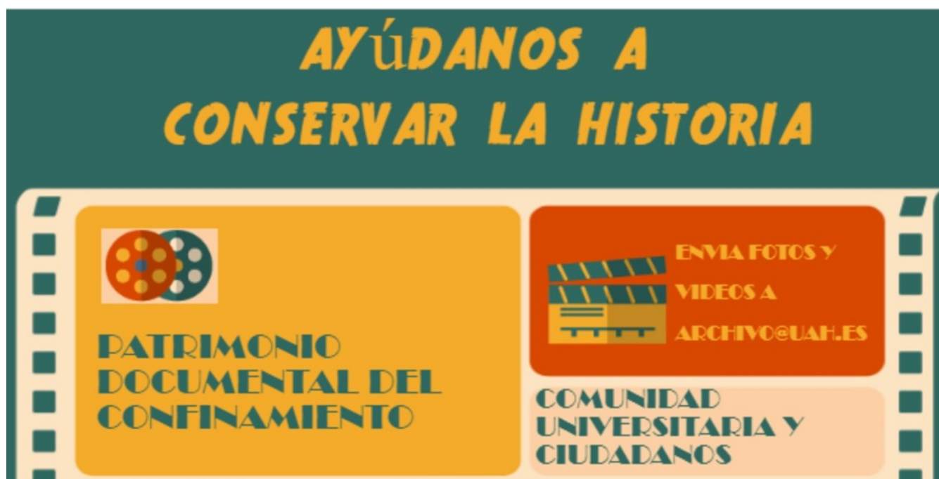
Infografía 1 Ayúdanos a conservar la historia 1

Se elaboraron dos infografías como herramienta de difusión de la iniciativa. Una de ellas con los datos más importantes que se usó como recordatorio de la acción del AUAH.