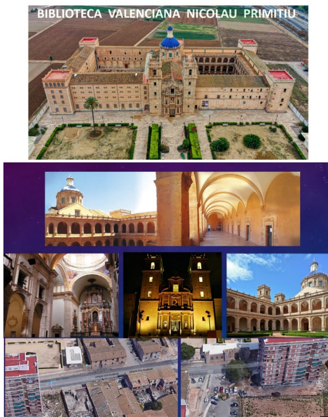
Imagen 1: Interior y exterior del Monasterio de San Miguel de los Reyes, sede de la Biblioteca Valenciana

Sant Bernat de Rascanya, el gran monasterio jerónimo de Sant Miquel dels Reis de los siglos XVI, XVII y XVIII y el presidio nacional de San Miguel de los Reyes de los siglos XIX y XX (Camps, 2000).