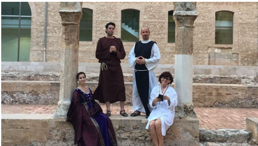
Imagen 3: Las visitas teatralizadas han permitido captar nuevo tipo de público