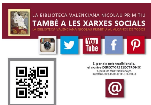
Imagen 5: Las redes sociales, bien utilizadas, pueden ayudarnos a dar a conocer nuestras bibliotecas

Así, la Biblioteca Valenciana se ha dotado a lo largo de estos últimos años de perfil propio en las principales redes sociales. Dispone de presencia propia en Facebook, Twitter, YouTube, Pinterest e Instagram.