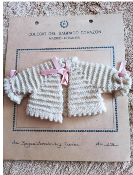
Ilustraciones 8 y 9 Labores Colegio Sagrado Corazón de Madrid