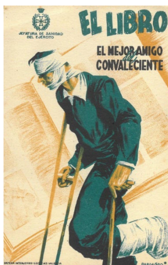
Figura 2: Cartel de la Jefatura de Sanidad del Ejército para incentivar la lectura entre los soldados

Paralelamente, en Cataluña el gobierno de la Generalitat, a través del director de la Biblioteca de Catalunya Jordi Rubió i Balaguer, creó el Servei de Biblioteques del Front , con el fin de llevar libros y revistas a los combatientes.