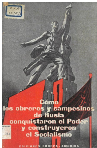
Figura 4: Libro de la Editorial Europa-América, con un diseño de estética soviética

Otro sello editorial presente es Europa-América , que publicaba obras marxistas y comunistas y de literatura revolucionaria, mayoritariamente en español. También hay obras de Ediciones Españolas que junto con la editorial Nuestro Pueblo , se convirtieron en las editoriales más importantes de la zona republicana (Martínez Rus, 2023, p. 130).