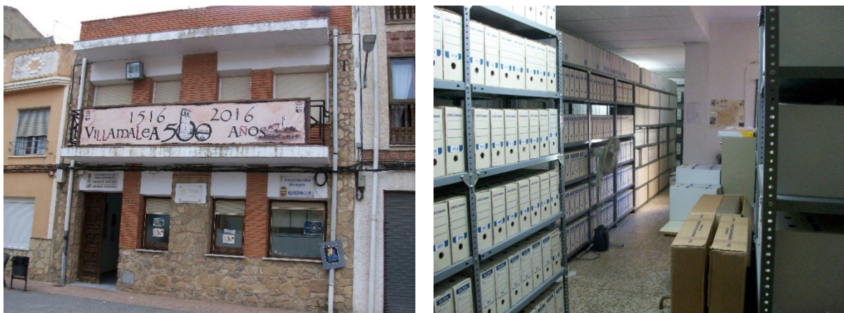
Imágenes 2 y 3 Antiguas instalaciones del Archivo Municipal de Villamalea