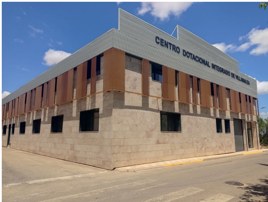
Imagen 1 Edificio donde se ubica el Archivo Municipal de Villamalea

Su archivo municipal se encuentra ubicado en la calle Dos de Mayo, un poco a las afueras de la población y en la planta baja del edificio conocido como “Centro Dotacional Integrado de Villamalea”, que en realidad es una antigua nave de confección de grandes dimensiones, adquirida en el año 2016 por el Ayuntamiento de Villamalea y rehabilitada poco tiempo después para albergar en ella las sedes de algunas asociaciones del pueblo y varios servicios municipales; entre ellos, el del archivo.