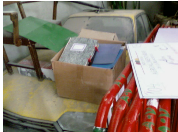
Imágenes 9 y 10

Estado en el que se encontraba en el año 2009 la documentación de la Hermandad Sindical de Labradores y Ganaderos y Cámara Agraria de Villamalea