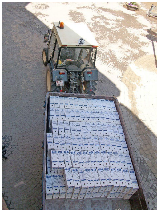
Imágenes 4 y 5 Trabajos de preparación y traslado del archivo en el verano de 2018

Las instalaciones en las que actualmente se encuentra ubicado el archivo municipal villamalense no son ni mucho menos modélicas, siguen presentando importantes deficiencias, como la falta de luz natural y la pobre iluminación artificial en el despacho del archivero y la sala de consultas de los usuarios, la ventilación forzada en todas las estancias o el paso de tuberías de aguas fecales sobre los elevados techos de los