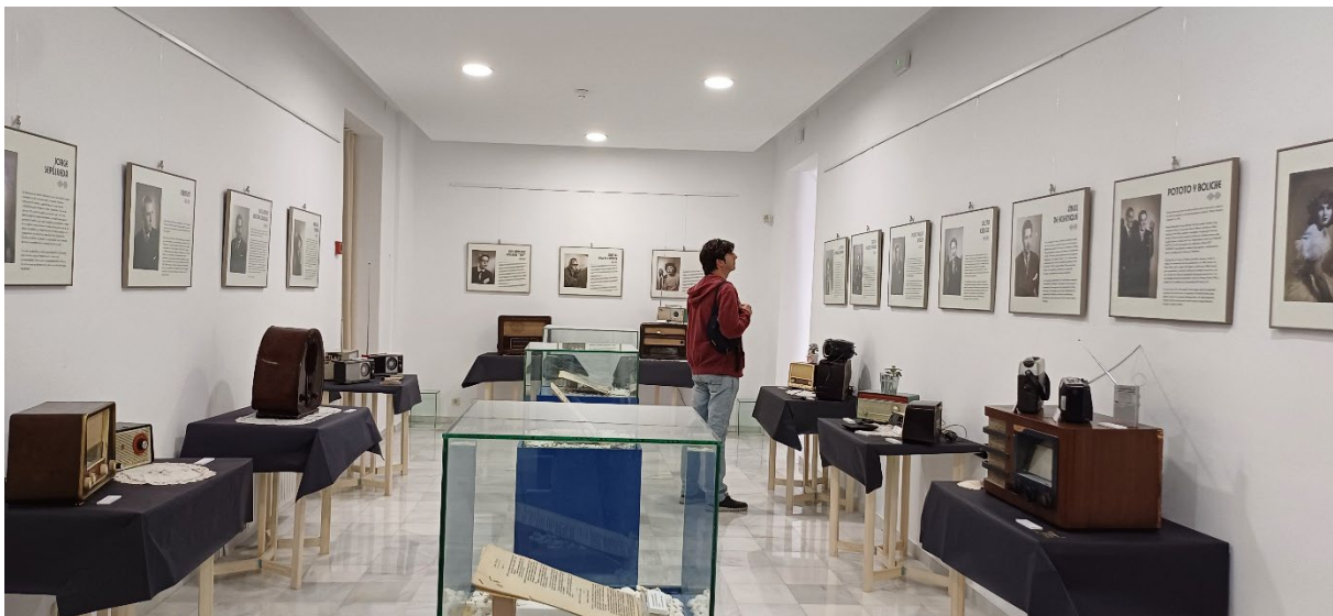
Figura 10 Foto AMH. Exposición donde se exhiben aparatos de radio antiguos

Así, por ejemplo, con motivo de la Fiesta del Libro, que este año giraba en torno a la Radio, a propuesta del Centro Joven, y la Red de Bibliotecas de Hellín, nos sumamos a las celebraciones del centenario de las primeras emisiones radiofónicas con continuidad en España y conseguimos realizar en el Archivo una exposición donde se exhibieron aparatos de radio desde los años treinta del siglo XX que habían sido aportados por los miembros de MUSSYPHE.