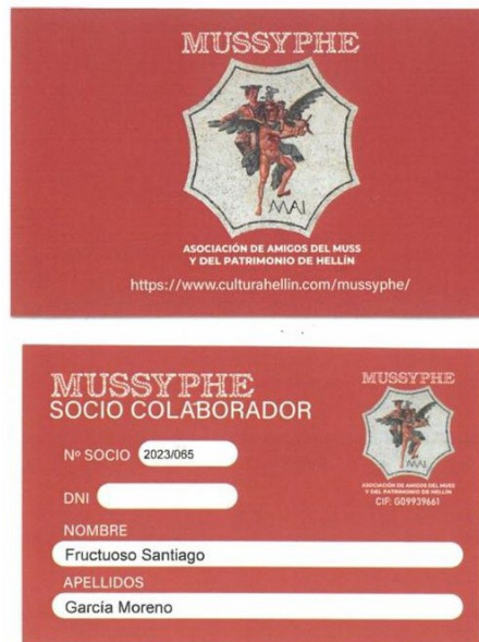
Figura 4 Tarjeta de socio/a

Cuando una persona desea hacerse socia, debe rellenar un formulario o ponerse en contacto con el Archivo 5 . Una vez que se le da de alta, se le proporciona también una tarjeta de socio. Como con las tarjetas comerciales de fidelización, estamos intentando conseguir descuentos para nuestros asociados que sean válidos, como sucede actualmente con quienes disponen de la tarjeta de la biblioteca, para sacar la entrada al cine, al teatro, etc.