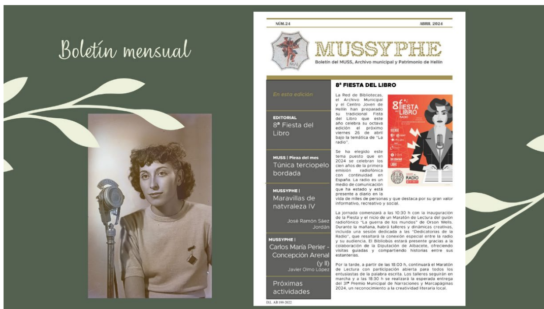
Figura 6 Boletín mensual

Otras actividades colaborativas se materializan en la edición de un boletín mensual 6 , que se difunde en el grupo de WhatsApp, en la web y se imprimen unos cuantos ejemplares en papel. Se trata de una publicación pequeñita, de cuatro páginas, en cuya editorial se destaca alguna noticia de interés: si es el día del libro, de los museos o de los archivos, si se aproxima el festival de cine...donde vamos contando lo que hacemos o lo que está previsto. Incluye siempre “la pieza del mes” del museo y algún artículo de investigación o divulgación sobre hechos, acontecimientos o personajes que forman parte de la historia de Hellín.