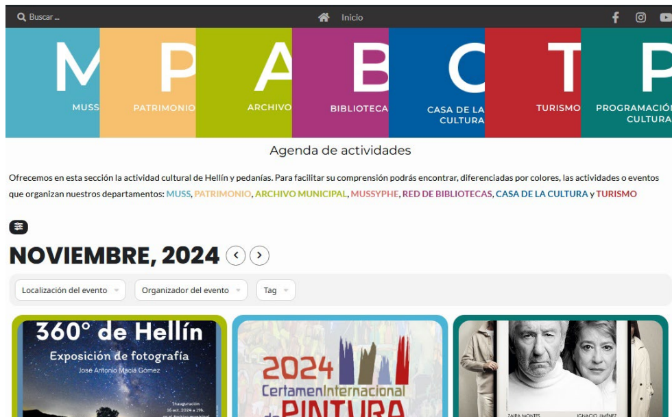
Figura 3 Cabecera de entrada a la web culturahellin.com

información y recursos relacionados con las actividades culturales que se llevan a cabo en la localidad.