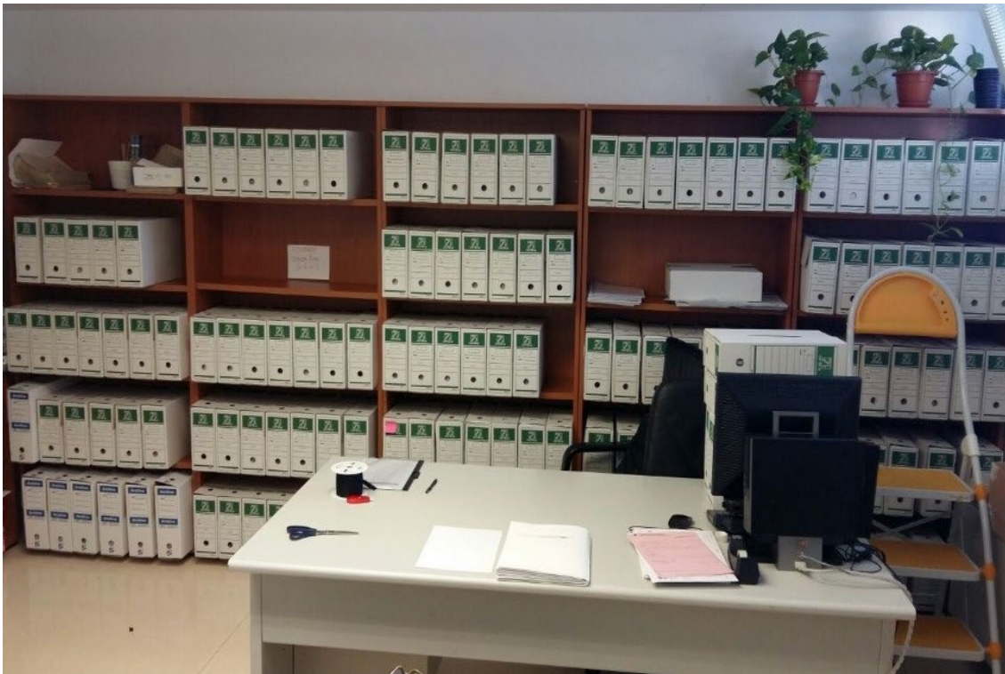
Imagen 2 Oficina de trabajo en el edificio José Prat (Vicerrectorado de Campus)