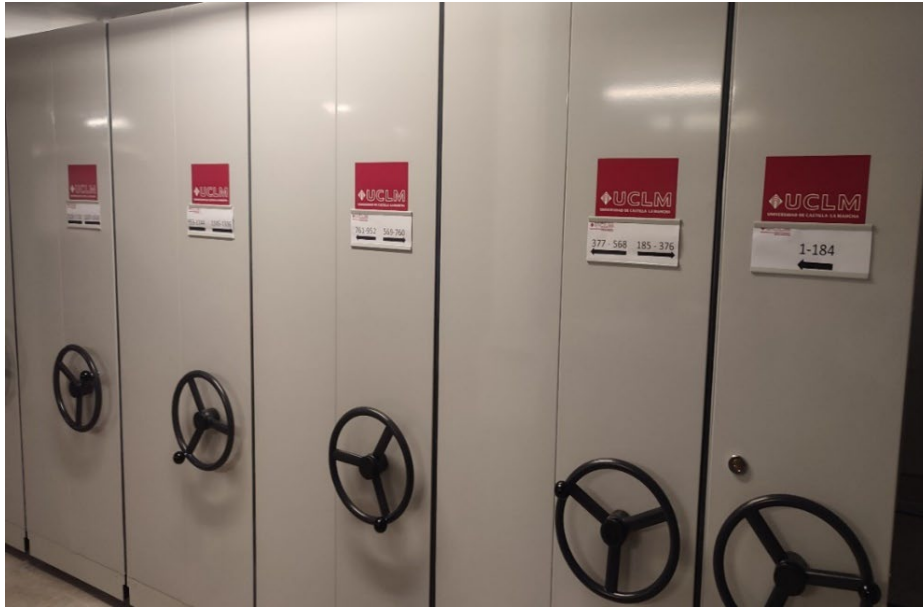
Imagen 3 Depósito de documentación del edificio Polivalente