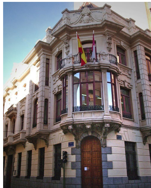
Fotografía actual del Archivo Histórico Provincial de Albacete en la calle San Julián/Padre Romano.