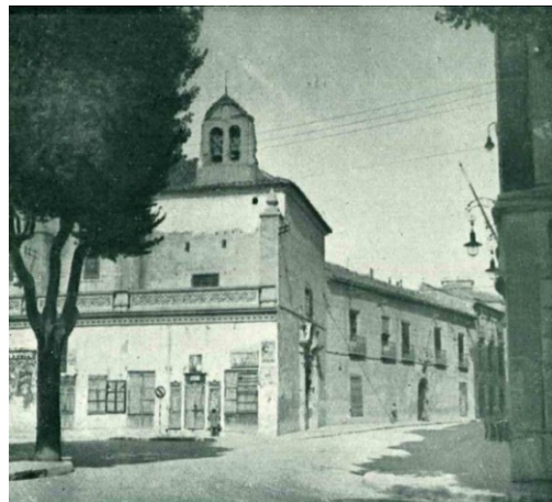
Convento de Justinianas en el Altozano, sede del archivo especial de Bienes Nacionales creado en 1859.

Los antecedentes más remotos del Archivo Histórico Provincial están relacionados con el proceso desamortizador y la documentación de Hacienda. Corría el año de 1859 cuando una circular estatal dirigida a la Dirección General de Propiedades del Estado obligó a las autoridades a crear archivos especiales del ramo, segregando de los archivos provinciales todos los documentos y legajos correspondientes a las propiedades desamortizadas con la obligación de habilitar una estancia del edificio a este objeto. Este fue el origen del archivo de Bienes Nacionales ubicado en el antiguo convento de Justinianas en la plaza del Altozano, sede de la Administración de Hacienda y de su sección de Propiedades y Derechos del Estado en