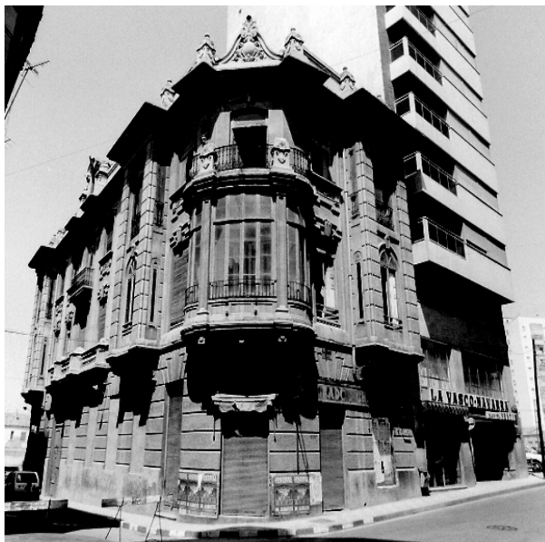
Imagen del edificio en agosto de 1982 antes de comenzar la restauración del definitivo edificio del Archivo Histórico Provincial.

En 1991 el archivo se trasladó a su definitiva ubicación en la calle Padre Romano esquina con San Julián en un edificio rehabilitado y catalogado, manteniendo exclusivamente la fachada dado que se encontraba en ruina interiormente sin posibilidad de recuperación.