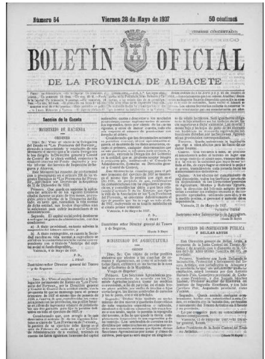
Boletín Oficial de la Provincia de Albacete, de fecha 28 de mayo de 1937, publicando la creación de la Junta Delegada de Incautación, Protección y Salvamento del Tesoro Artístico

La Constitución de 1931 fue la primera Carta Magna española en incluir un artículo especialmente dedicado al patrimonio, su defensa y su conservación por parte del Estado (art. 45). Una de las medidas más trascendentales para los archivos fue el Decreto de 12 de noviembre de 1931 de creación de los históricos provinciales, que ordenaba en el párrafo 2º del preámbulo lo siguiente: “habrá de concentrarse la documentación histórica que se halla dispersa por España en multitud de archivos y dependencias de diversas entidades, en riesgo de desaparecer”, documentación que, añade el decreto, servirá para el estudio de las historias locales y provinciales, por lo que considera necesario exigir a los Ayuntamientos de las capitales de provincia y Diputaciones el mínimo de ayuda y colaboración para este fin 2 . A continuación surgieron nuevas leyes y nuevos organismos de protección como la Ley del Tesoro Artístico Nacional (nombre que recibía el patrimonio cultural) de 13 de mayo de 1933 y la creación de la Junta Superior del Tesoro Artístico Nacional como órgano consultivo, en 1936, que se transformaría al comenzar la guerra en la Junta de Incautación y Protección del Tesoro Artístico, órganos que cambiarían de nombre a lo largo del tiempo, pero que conservarían la misma finalidad, entre ellas velar por los archivos, las bibliotecas y los museos 3 .