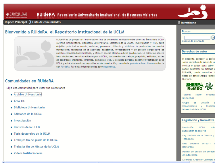
Imagen 3 Página de inicio de RUIDeRA https://ruidera.uclm.es

RUIDeRA almacena actualmente cerca de 2.000 documentos en formato digital de diversa tipología como monografías, artículos, publicaciones periódicas, memorias, informes, tesis doctorales, trabajos de investigación, publicaciones oficiales, normativa institucional y también documentación histórica producidos todos ellos bien por la UCLM, bien por cualquier miembro de su comunidad universitaria: personal de administración y servicios, personal docente e investigador o estudiantes.