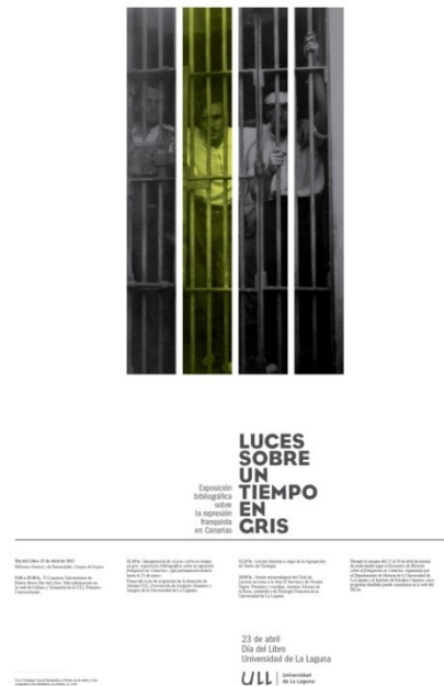
Ilustración 1 Cartel de la exposición

En este apartado trataré de describir de forma sucinta dos temas que nos han preocupado desde hace años, el desarrollo bibliotecario de Canarias y la escasa habilidad de nuestros estudiantes para utilizar la información y como se hemos tratado de aportar nuestra colaboración en ambos aspectos.