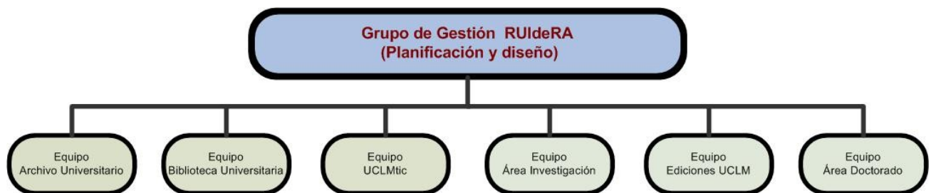
Figura 2. Grupo de Gestión RUIdeRA. Estructura.

Como proyecto transversal de varias áreas, para el diseño y la gestión del repositorio, se creó un grupo de trabajo en el que participan las direcciones de cada una de ellas, así como los técnicos responsables. Después, cada equipo, a su vez, es el responsable de organizar su propio grupo, con las asignaciones y tareas correspondientes.