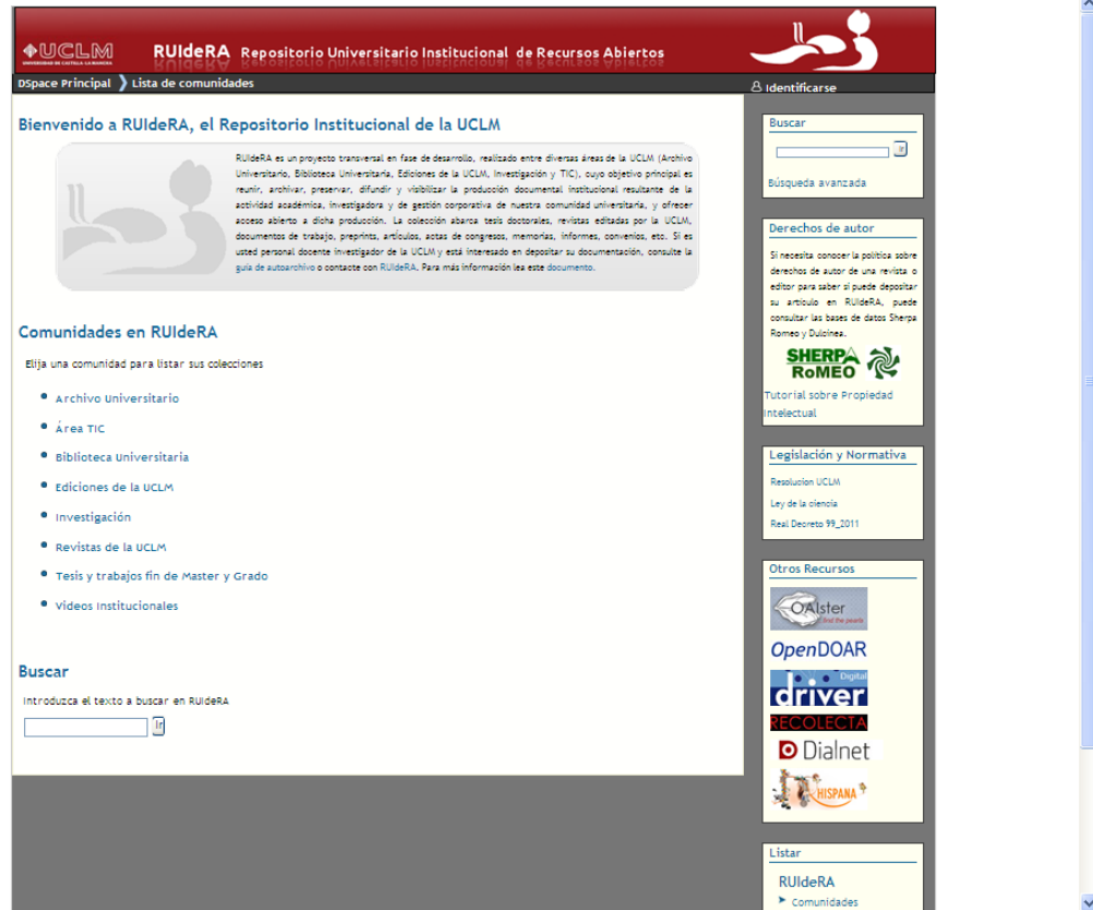
Figura 1. RUIdeRA. Página de inicio.

RUIdeRA puede definirse como un modelo particular de repositorio digital institucional, basado en el concepto de “transversalidad”. Entendemos por transversalidad la capacidad del proyecto para: