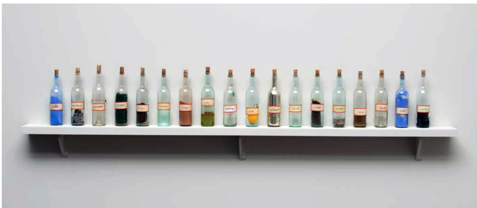
Luis Camnitzer. Tratado sobre el paisaje , 1996. Vista de instalación, Museo Nacional Centro de Arte Reina Sofía, 2018.

L. C.: Para mí el acento de la obra de arte siempre estuvo en el efecto que puede producir en el espectador y no en la obra misma. Es por eso que para mí el arte siempre fue un instrumento educativo y no una manera de producir objetos. Hasta cierto punto esta posición implicaba la desmaterialización, y el grabado en su multiplicación ya era una forma inicial de diluir la unicidad de la presencia material original. En la época y en diversas formas, este era un problema que estaba en el aire. La comunicación tomaba prioridad sobre la producción y todos estábamos influidos por la teoría de la información que se estaba poniendo de moda en el mundo artístico, tanto hegemónico como en Latinoamérica.