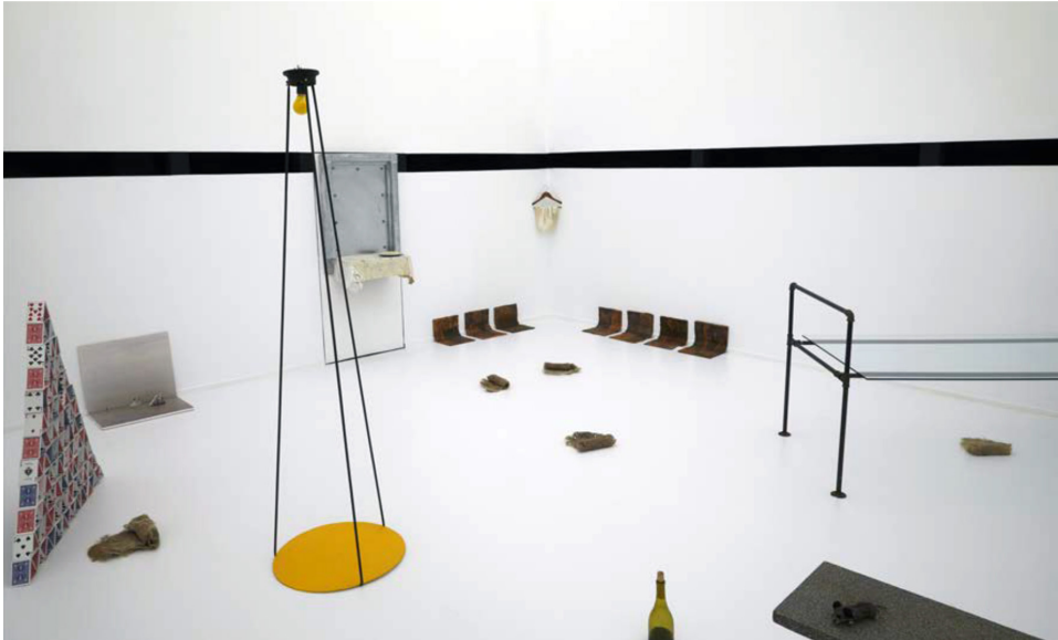
Luis Camnitzer. Hospicio de Utopías Fallidas . Vista de instalación, Museo Nacional Centro de Arte Reina Sofia, 2018.

Luis Camnitzer: “Arte conceptual” se refiere a un ismo estético hegemónico que trata de poner un arte desmaterializado en una categoría paralela al cubismo y al surrealismo. Para Latinoamérica yo prefiero utilizar “Arte conceptualista” porque allí se trató (y hoy seguramente se tratará) de establecer estrategias de comunicación que ayuden a esquivar la represión y el terrorismo de estado. Estas estrategias muchas veces requieren la desmaterialización, pero eso es un problema de eficiencia y no de estética. Como en esto los resultados se parecen formalmente a los productos hegemónicos, la historia hegemónica trata de fusionar ambas manifestaciones en un estilo formalista. Esa fusión esconde la importancia política del arte conceptualista y trata de hacerlo inofensivo, ignorando que está dirigido a responder a una crisis social más que a un problema estético. Está claro que todas estas consideraciones son excesivamente esquemáticas. Hay estrategias conceptualistas en el arte hegemónico (Hans Haacke y Martha Rosler, entre ellos) y hay esteticistas en el arte latinoamericano. De hecho tengo que confesar que al principio yo estaba oscilando entre ambos cuando en 1966 empecé a utilizar el texto como recurso. En términos de fecha supongo que estoy en las fases iniciales de ambas versiones. Pero por razones obvias me interesa más el arte conceptualista. Dado que se trata de estrategias, no es algo que caduque porque sus apariencias formales puedan ser fechadas.